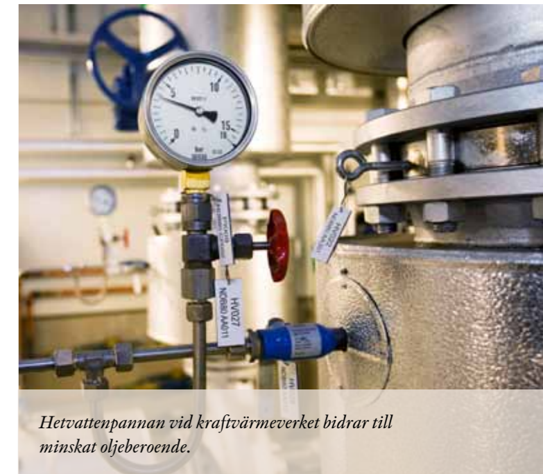
Hetvattenpannan vid kraftvärmeverket bidrar till minskat oljeberoende.

Under året noterades en signifikant ökning av flispri-serna vid nytecknande av inköpsavtal för eldnings-säsongen 2009-2010. Brist på flis och grot har drivit upp priserna. Efter stormarna Gudrun och Per har tillgången på skogsråvara varit god med en moderat prisbild under några års tid. Dessa lager är nu tömda med prisökningar som följd. I kölvattnet av lågkonjunkturen har prisnivån stigit ytterligare. En bristsituation har uppstått på grund av att skogsägare har begränsat avverkningen, eftersom efterfrågan på träprodukter har sjunkit.