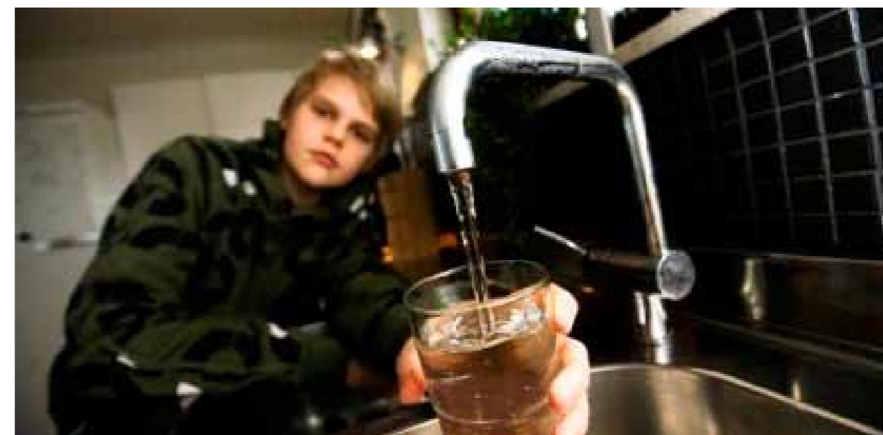
Under 2009 förbrukades 1.610.000 m 3 vatten som produceras i 14 vattenverk och distribueras i ett ledningsnät som omfattar 61 mil ledningar.

I september 2009 fastställdes nya allmänna bestämmelser för brukande av Nässjö kommuns allmänna VA-anläggningar, populärt benämnda ABVA. Under 2010 kommer samtliga VA-kunder att få förenklad information som klargör NAVs ansvar. Informationen inkluderar även de regler och bestämmelser som våra kunder måste efterleva när det gäller anslutning till vatten- och avloppssystemet.